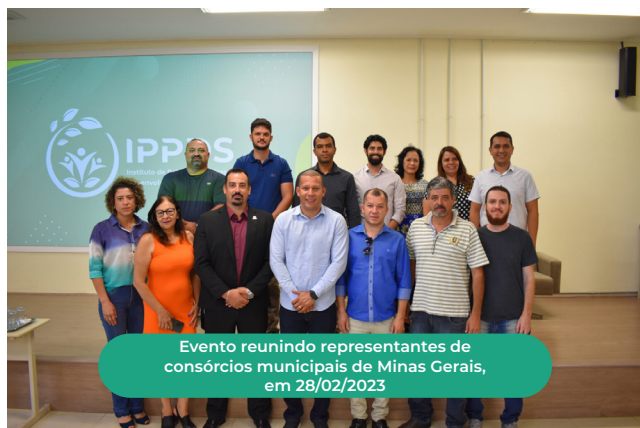
Evento reunindo representantes de consórcios municipais de Minas Gerais, em 28/02/2023