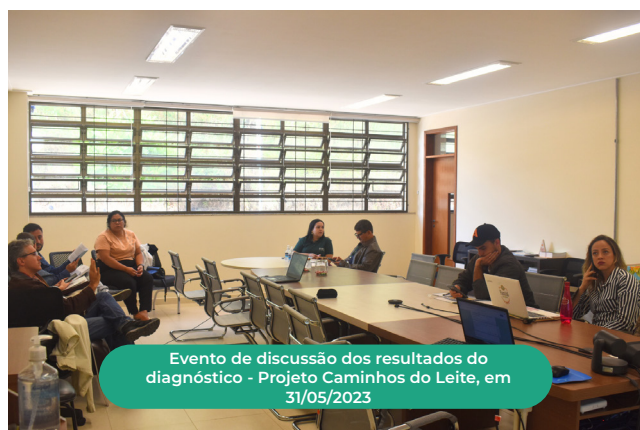
Evento de discussão dos resultados do diagnóstico - Projeto Caminhos do Leite, em 31/05/2023