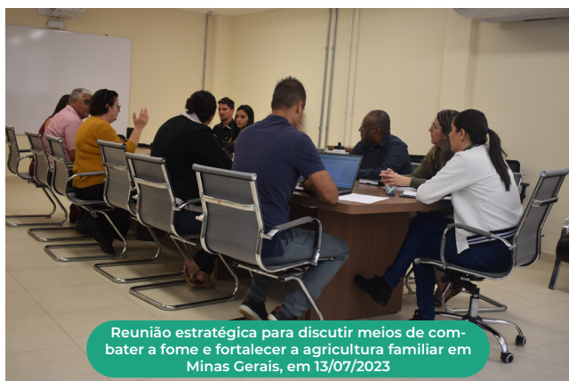
Reunião estratégica para discutir meios de combater a fome e fortalecer a agricultura familiar em Minas Gerais, em 13/07/2023