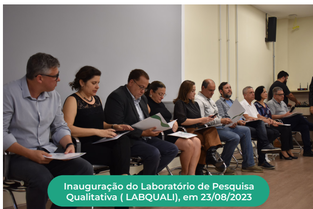
Inauguração do Laboratório de Pesquisa Qualitativa (LABQUALI), em 23/08/2023